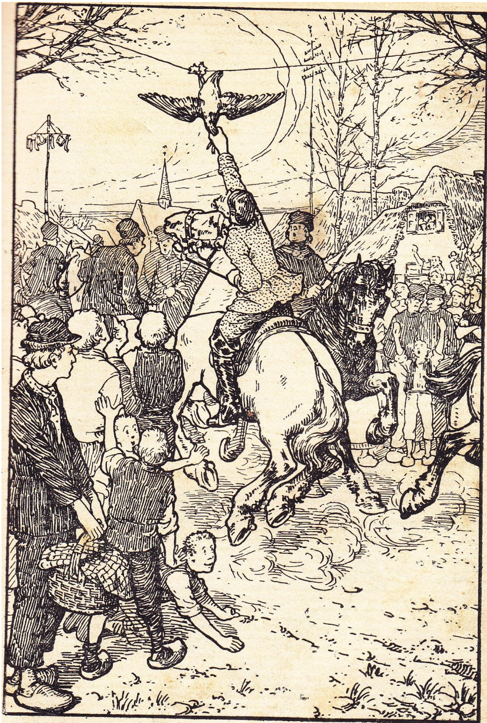
De aanschouwers hadden allen het oog op dien geduchten sprong. (Bladz. 148).

Pentekening bladzijde 161 / illustration page 161 hoofdstuk XIII / chapitre XIII : « In het bootje en in de hut »