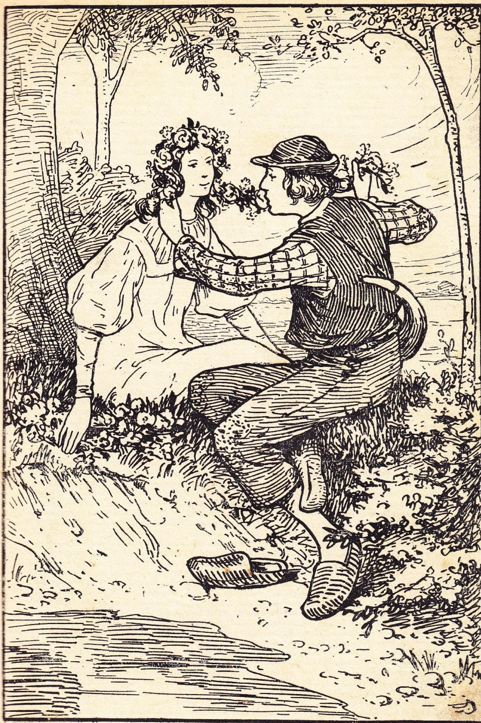
En kransen voor de kleine Coba vlechten... (Bladz. 19).

Pentekening bladzijde 33 / illustration page 33 hoofdstuk II / chapitre II : « De eerste doorn in de rozen »